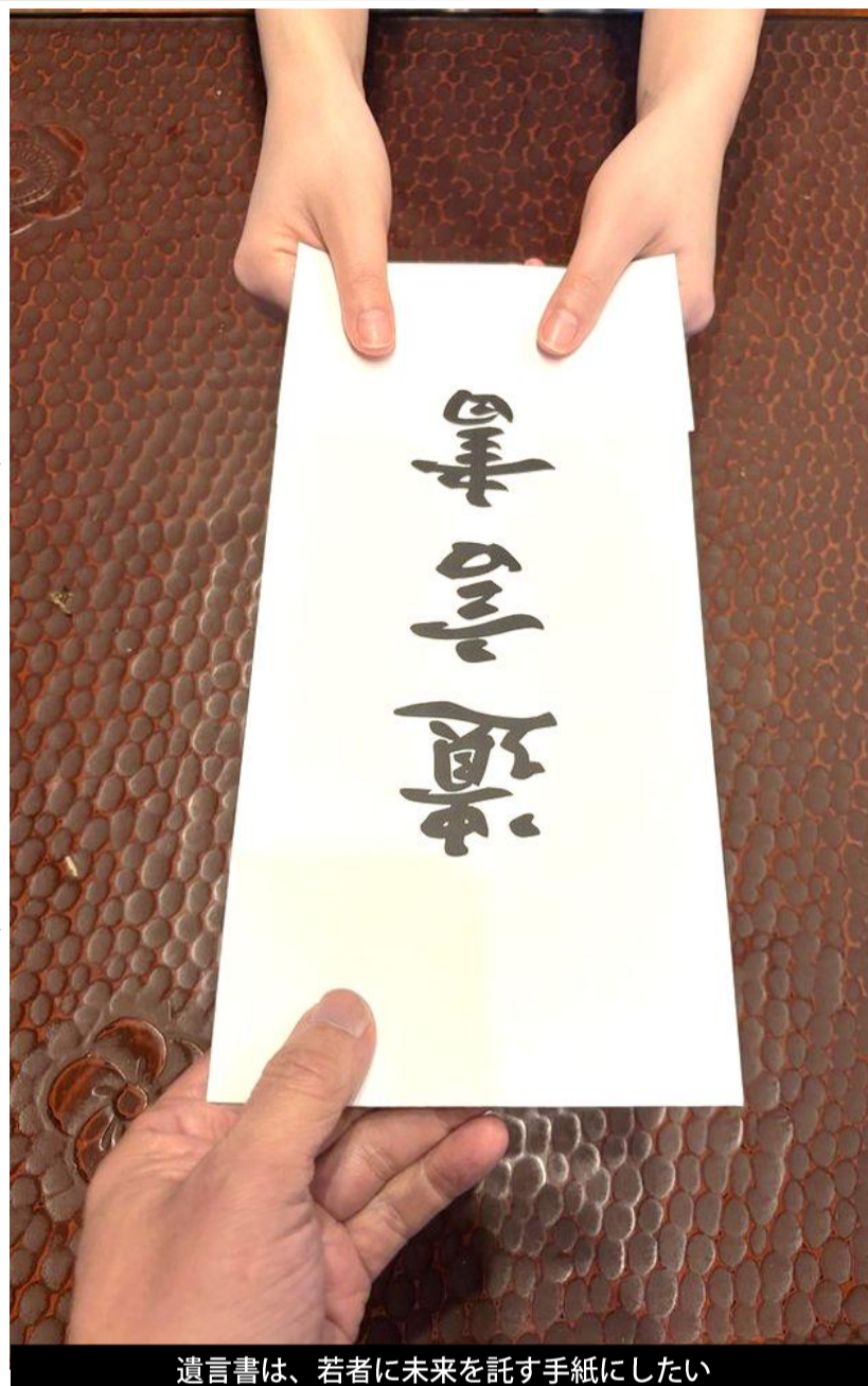
遺言書は、若者に未来を託す手紙にしたい

遺言書を書くことは、大きく分けて「自分が死んだときに誰に譲りたいのか」と「それらを誰に譲りたいのか」の2点です。でも、そもそも自分がいつ死ぬのか、そしてその時誰が何を必要としているのかもわからないのに、その時に何が残り、それらに対する願いや希望を考へることなどとても無理です。そこで、それらの事例を学ぶ様々なセミナーや文献が関心を集め、笑恵館で開催する「終活を知ろうよう会」でもこの問題を取り上げています。でも、私は初めに述べた遺言の内容に、2つの違和感を感じます。