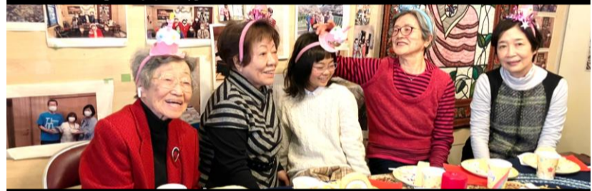
3月のKさんのお誕生会は、3月生まれの皆さんと