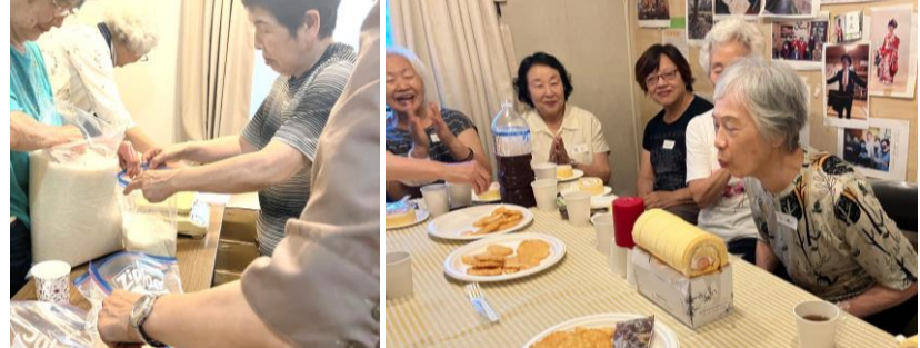
お米の小分け作業