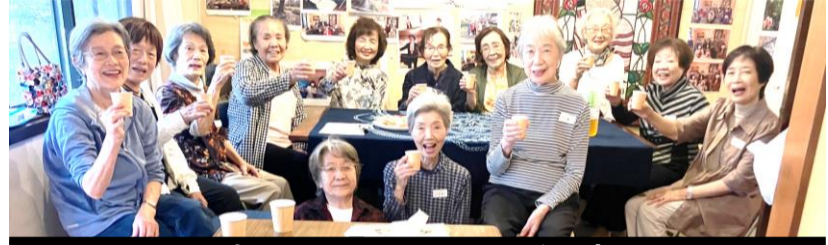
先月(10/27)のおしゃべり会