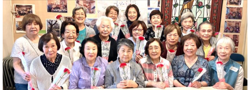
母の日に赤いカーネーションのプレゼント