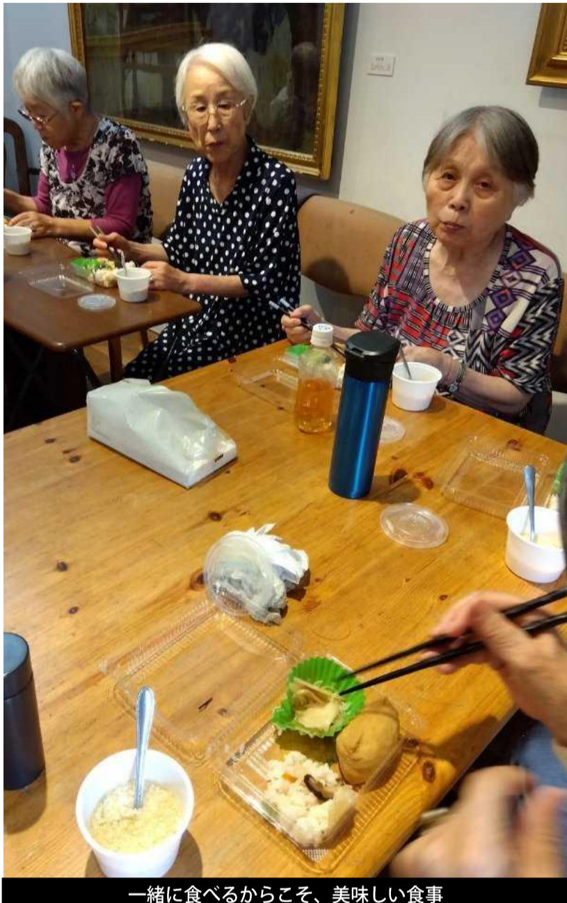
一緒に食べるからこそ、美味しい食事

第2と第4火曜日に開催中の高齢者の集い「ほほえみ」は、以前は10時から昼食をはさんで14時まで開催していましたが、始めのうちはスタッフが昼食を作っていました。ところが、やがて作って下さる方が現れて、昼食後もゆっくりにおしゃべりや歌を楽しみながら、14時頃まで過ごすようになりました。4年前に始まったコロナ禍により昼食無しの12時までとなっていました。