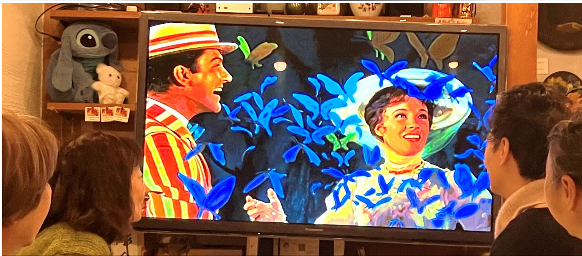
1月の夜の部はメリーポピンズを見ました

2024年(令和6年)2月1日・木曜日発行 発行 / 田名 夢子 製作 / 松村 拓也