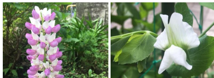
花壇に咲くルピナスと、スナップエンドウ