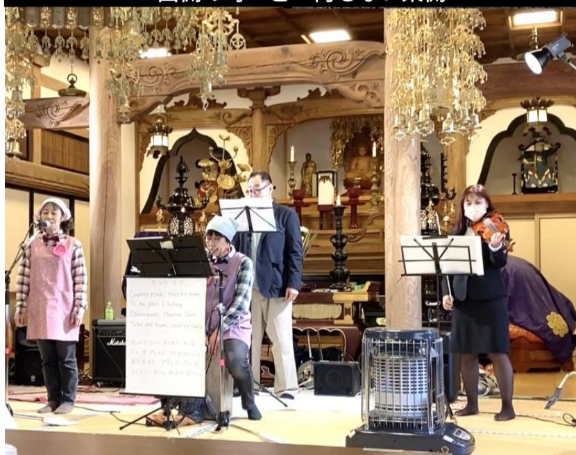
楽しく盛り上がるお寺のイベント

原発事故の影響で放射線量が極めて高く、住民の立ち入りを制限している地域を帰還困難区域といえます。今回宿泊した小高地域は2016年に制限解除され、比較的早く住民が町に戻れた地域です。南北に伸びる線路を境に、西側にはかつての住宅街が広がるものの、津波が押し寄せた東側は現在も更地のままです。東西で全く違う世界が広がっています。津波による浸水を受けた土地は、海水に浸ったため田畑としての利用は難しいとのことでした。