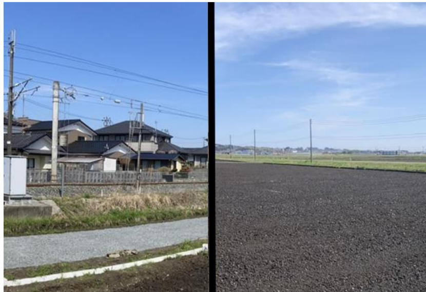
西側の町 と 何もない東側