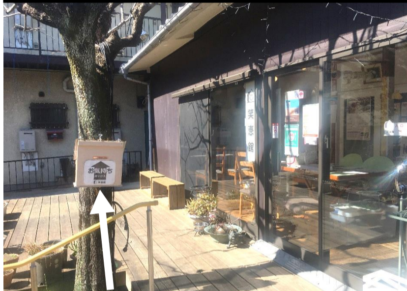
あえて入り口の前に置きました

ある日のやり取りから… 笑恵館入口前の柿の木に、「お気持ちボックス」を設置して2週間が経った頃、部屋を利用して小学生が尋ねてきて、「こんなやり取りがありました。」 小「お気持ちボックスって何ですか？」 私「何だと思っ？」 小「お金をいれるもの？」 私「そうだね、でもお金だけじゃなくて、お手紙なんかでもいいよ。」 小「ふーん。ありがとうございます。」