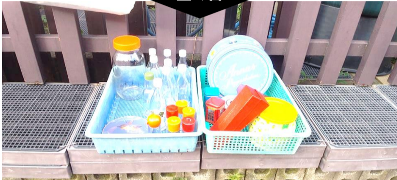
見る見る消えていく不用品たち