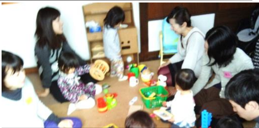
これまでの「子育てサロン 砧にこここ」の様子

【子育てサロンの引継ぎ】 笑恵館が開館する3年半前の2010年11月から、奥にあるアパートの二室で始めた子育てサロンは、笑恵館内の二階に引き継がれ、約十年間で360回余り開催して、その間延べで約3千組余の親子さんと赤ちゃんに利用して頂いてきました。当時の赤ちゃんはもう小学四年生になつています。スタッフは6人から始まり途中入れ替わりなどありましたが、十七人の皆様に支えて頂いてきました。 今年3月以降のコロナ禍により休止したため、その間スタッフの高齢化などもあり、再会は無理かと思つていました。が、一時手伝つて下さった若いグループの方々が新たな形で継続したいと申し出て下さいますので、有難くお願いすることにしました。 新しい子育てサロンは、ここにKUU、どうぞ宜しくお願いします。(田名夢子)