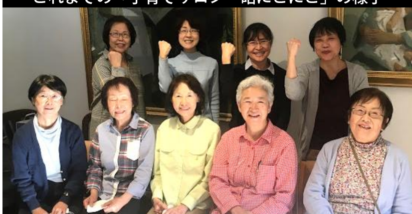
旧メンバーと新メンバー(後列右3名)

【はじめまして!】 「にこここKUU」は、妊婦さんと子育て中のママ、そして地域の皆さまとの出会いの場です。子育て支援に長く関わってきた3名で「砧にこここ」から引き継がせていただき、引き続き、ぜひ、お立ち寄りください。 今は、溺れそうなほど情報過多の子育て困難時代。赤ちゃんが愛おしい存在であるほど、悩み揺れるママがたくさんいられます。生まれてくる赤ちゃんが、地域の皆さまに「おおきくなったねー」と声をかけられ、抱っこされて、すくすく育ってほしいなあ、と願っています。ご一緒に、ママと赤ちゃんの笑顔を応援し、てくださいね。 【妊婦さんとママへ】 赤ちゃん向け絵本の読み聞かせもあります。お気軽におしゃべりにいらしてください。(鈴木昭子)