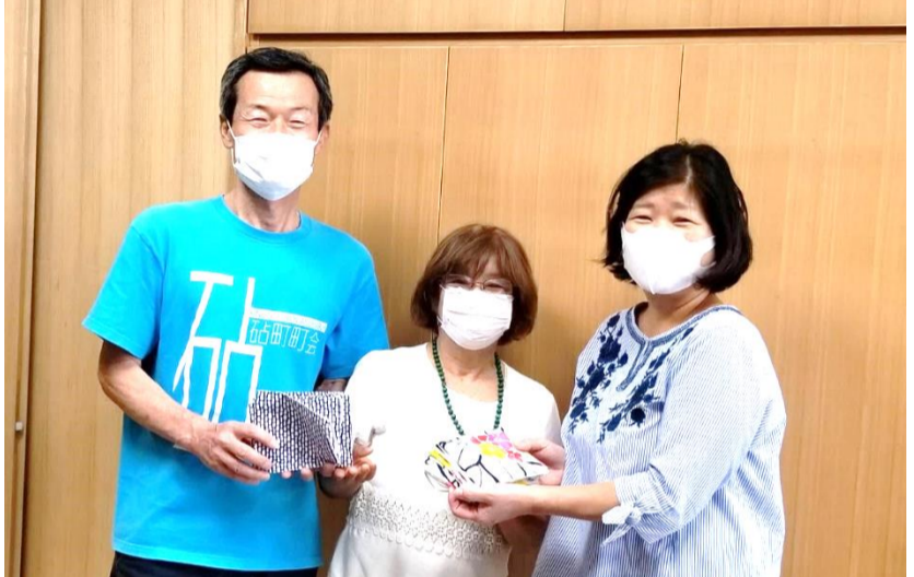
砧町会長(左)と一緒に山野小校長先生(右)に贈呈

砧4丁目「くつろぎ処・おおがいさんち」は笑恵館から歩いて7分、山野小学校の近くです。第二、第三の笑恵館を作ろうと意気込んでいた笑恵館スタッフの誘いに乗って、4年ほど前に我が家の一部を、みんなで集う「場」にしました。そして、高齢者や親子づれが楽しい時間を過ごしてきました。