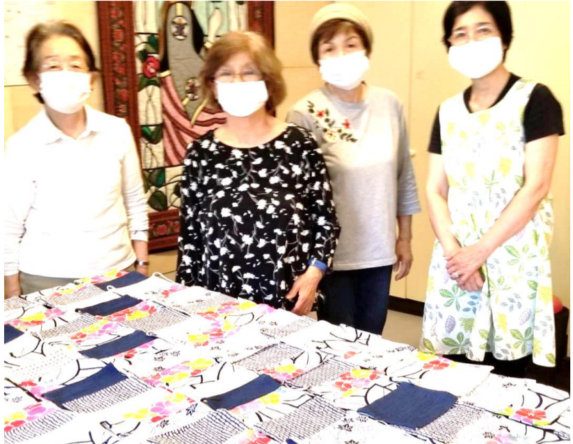
浴衣で作ったカラフルマスクとおばちゃんメンバー

NPO法人ACTたすけあいワーカーズ えん千歳台 ご近所に助けていただきたい ご近所を助けて差し上げたい 月々金9〜17時ならいつでも 笑恵館でお電話お待ちしております! 6821-1777