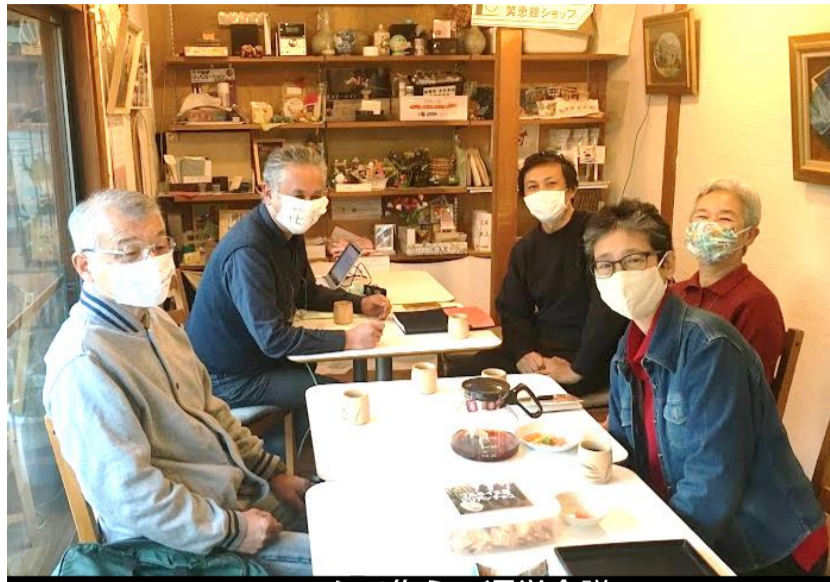
マスクで集う、運営会議

⑤ これで出来上がり、針金部分を鼻に合わせて曲げながらつけてみましょう。裏表はありません。外出用なら継ぎ目を内に、室内用なら外側にすると良いでしょう。