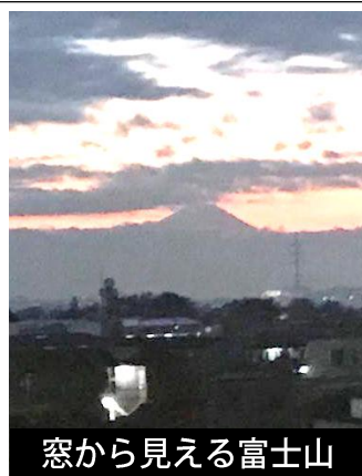
窓から見える富士山

「せたがやブレッドマーケット」 営業時間: 9時~18時 気まぐれラスク 1個300円、2個500円 甘い味からしょっぱい味まで 全15種類以上!見かけたらずい!