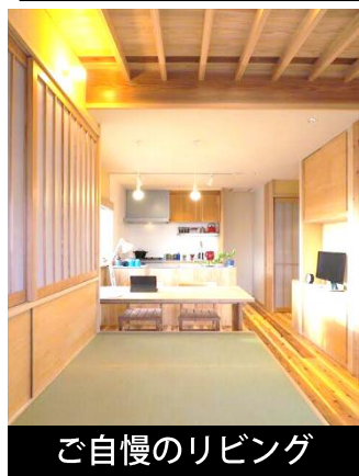
ご自慢のリビング

Yさんがこだわったのは、今後少しずつお友達を受入れながら、ご自宅での交流を楽しむために作った、豊かな小上がりの有る素敵なリビングだそう。