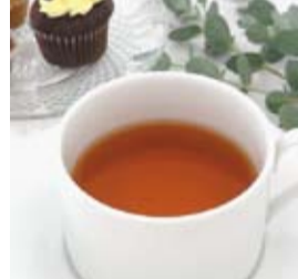
ティーハウスレンファ 産直の新鮮紅茶をご提供します