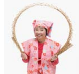
梅ちゃん 街のお楽しませやさんです