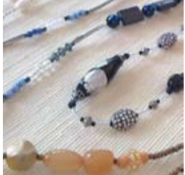
アトリエ ケイ 夏のアクセサリが沢山できました