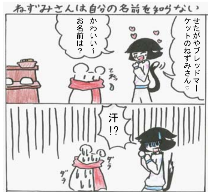
ともかばさん(6年生)の作品です。