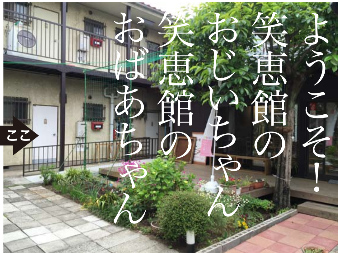
募集中の101号室は、笑恵館の庭に面した特等席です。

笑恵館アパートの101号室は、庭に面した特等席です。この部屋は開業当初より「高齢者の入居を優先する部屋」と考えていましたが、なかなか縁がありませんでした。このたび、入居者が帰省のため退去なさることにになり、この際思い切って「高齢者に限定して入居者募集をしてみよう」と思い立ちました。 笑恵館アパートには、次の4つの特徴があります。 ①専用居室のほか、笑恵館の施設や庭を自由に使うことができます。 ②居室は住居としてだけでなく、仕事場などとしても使うことができます。 ③1年契約ですが、何回でも無料で更新できます。 ④緊急時に対応するため、必要な連絡先を届け出てください。連帯保証人は不要です。 入居に関しては、まず笑恵館クラブに入会し、イベントへ参加や、お話し入居などを経て、ご納得いただいたら、お決めください。 なお、今お住まいのお宅の片付けや、有効活用に関するご相談も大歓迎です。今回の募集とは関係なく、いつでも承りますので、気軽にお問い合わせください。(松村) ※限定募集期間は7月末日まで。