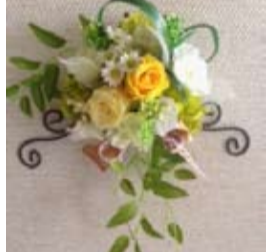
フルール プリザーブドフラワーのご紹介