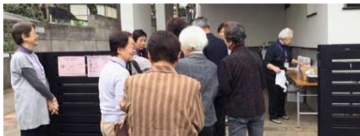
続々とやってくる、ご近所の皆さんたち