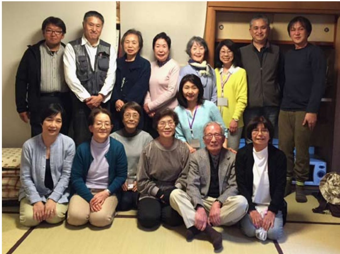
オープニングイベントを終えて、OBKメンバーとサポーターの皆さん