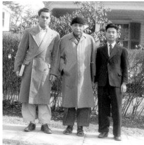
アインシュタインと一緒に(右側)