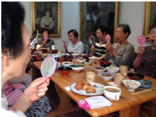
食事の前は、鏡を見ながら「くちの体操」

笑恵館内で手作りした昼食を、皆様と共に頂きます。準備や人数調整の都合上、カレーライスのようなものが増えていますが、もしも調理好きの方がいらしたら、一緒に作る楽しみがあってもいいかと思っています。是非ご参加ください。