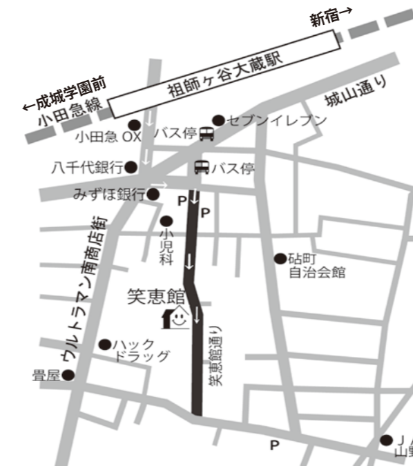
※笑恵館の前の通りを勝手に「笑恵館通り」と命名しました。

【今月のつぶやき】 本誌(笑恵館だより)の編集スタッフ、店番スタッフなどを募集しています。笑恵館の日常を楽しみ、写真や文章にしてみたい方、気軽に声をおかけ下さい。(ゆ)